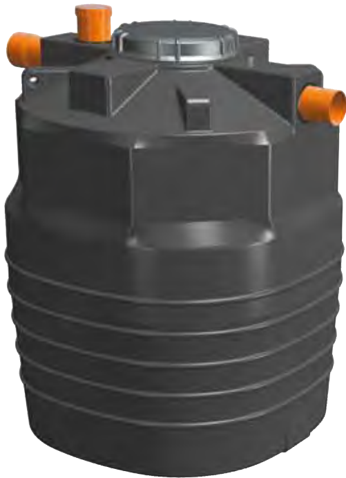
DEGRASSATORE MOD. STANDARD